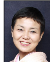
つやま けいこ 津山 恵子 ジャーナリスト